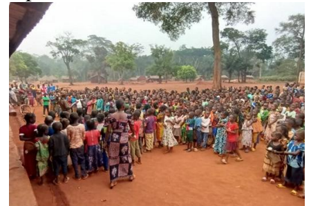
L'école de Niakari. Les nombreux enfants écoutent les vœux de l'équipe enseignante.